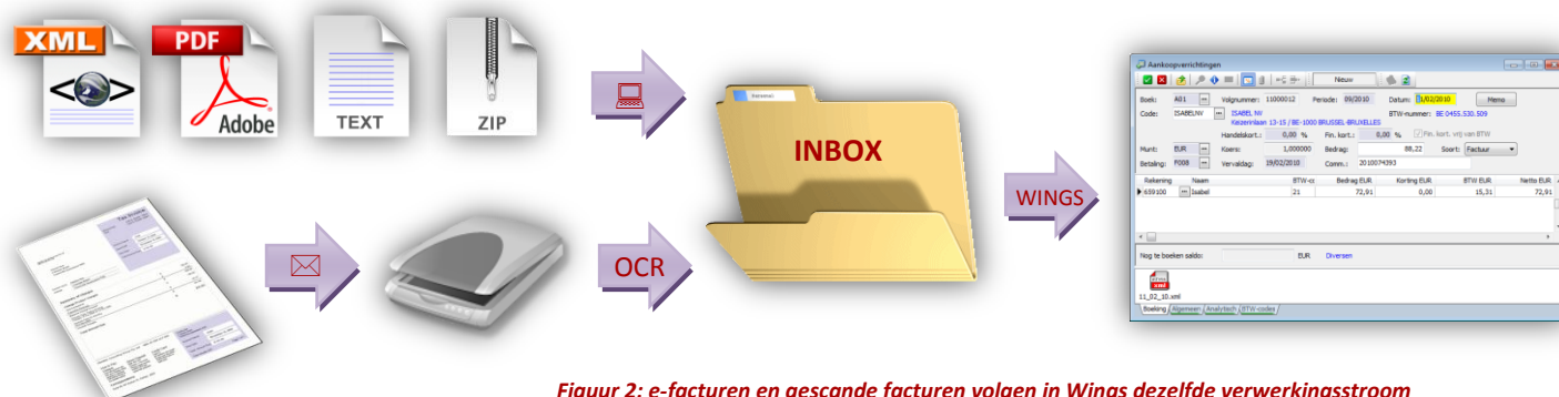
Figuur 2: e-facturen en gescande facturen volgen in Wings dezelfde verwerkingsstroom

Uniek in Wings is dat de in 2009 ontwikkelde factuurherkenning standaard* ingewerkt is. Deze biedt – zonder extra licentiekosten, zonder hardwarebeveiliging en zonder beperking op aantal ingelezen facturen – één van de beste herkenningratio's die vandaag beschikbaar zijn.